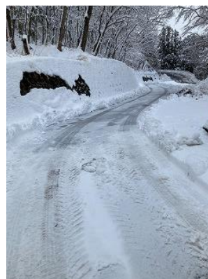
除雪されていた学校入り口