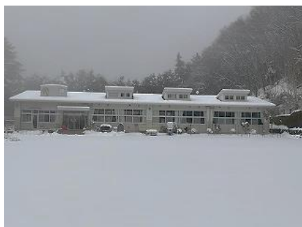
すっぽり雪に埋もれた校舎