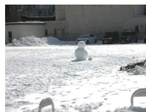
こどもたちが作った雪だるま

2月5日(月)の昼前から降り始めた雪がみるみるまわりの景色を白くしていきました。午後の授業をカットし、翌日の6日(火)は休校としました。